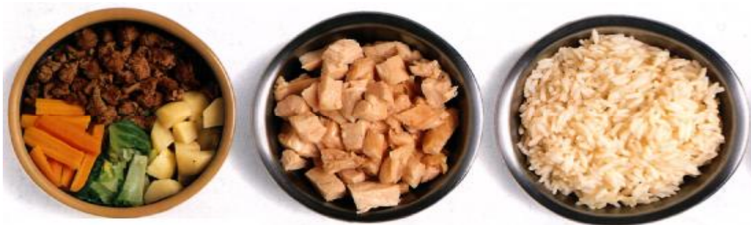
Rôzne druhy potravy