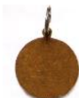
ciaška (identifikačný znak)